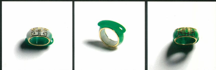
翡翠飾物不一定要配搭西裝革履，素色 T 恤、牛仔外套和卡其色長褲的休閒裝束亦能帶來成熟穩重、貼近潮流而不老土的形象。