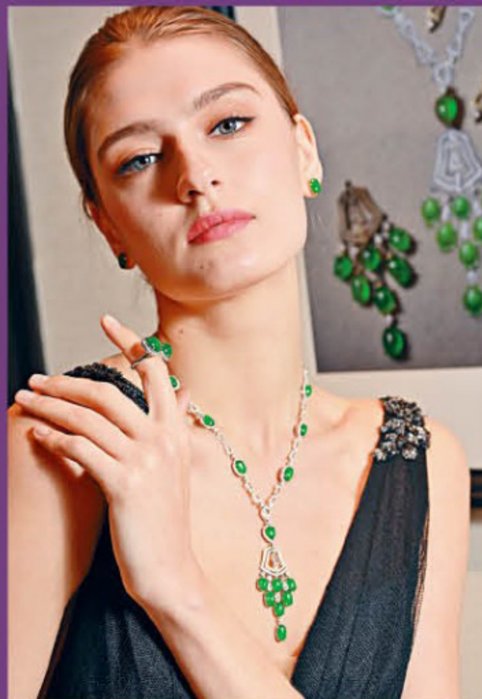
18K白金天然翡翠配鑽石項鍊/$4,900,000，以十四顆天然翡翠為主石，共重40.87卡，鑲嵌逾千顆梨形、明亮式切割圓鑽，共重14.58卡。18K黃金天然翡翠配鑽石耳環/$238,000，兩顆天然翡翠共重8.82卡。18K黃金天然翡翠鑲鑽石指環/$980,000，兩顆天然翡翠共重14.85卡。

Jade(玉)一字源自西班牙，稱之為「piedra de ijada」，當中「ijada」由拉丁文ilia(意指腸)和abdomen(意指腹)組合而成，意思是「腰石」，因為昔日中美洲文化印第安人的信念，認為這些「石頭」能夠治療腰部和腎臟的病痛。建東珠寶的英文名字正是以拉丁文「ILIA」命名，中文名則寓意「建於東方」，意將中國翡翠瑰璋玉石的文化歷史，引領到當代和國際舞台。