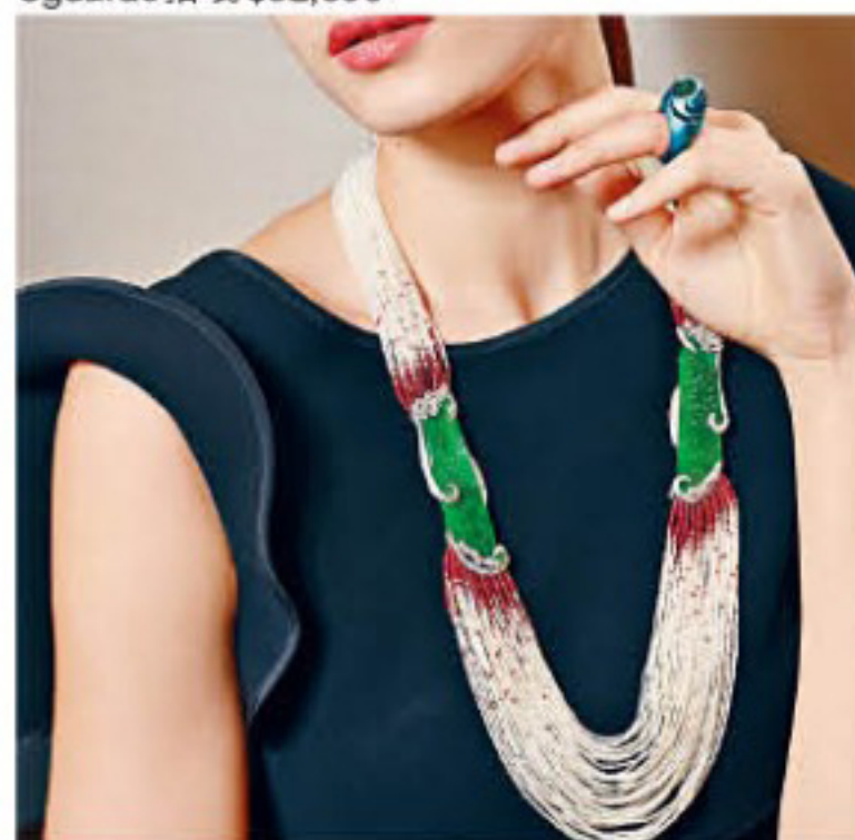
ILIA x SCAVIA系列18K白金高級翡翠項鍊/$9,000,000，拼湊仿古銅器龍鳳件天然翡翠配紅寶、祖母綠及日本Akoya養珠、翡翠共重119.48卡、紅寶珠共重141.49卡、祖母綠珠共重3.9卡、日本Akoya養珠共重307.77卡，以及鑽石共重14.58卡。ILIA x SCAVIA聯乘系列藍色鈦金屬眼睛Sguardo指環/$32,800，翡翠重1.11卡。