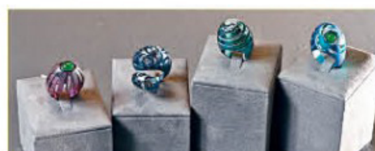
ILIA x SCAVIA系列指環系列，以藍或綠色鈦金屬拼鑽石及翡翠。左起/紫色丁香Spicchi指環/$32,800、Love You指環/$26,800、Spirale指環/$26,800、Sguardo指環/$32,800。