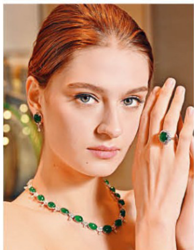
18K白金天然翡翠鑲鑽項鍊/$11,200,000，十一顆天然翡翠共重61.58卡，鑲嵌逾五百顆梨形、馬眼形及明亮式切割圓鑽，共重12.51卡。18K白金鑽石耳環/$580,000，鑲嵌兩顆共重8.86卡天然翡翠。18K白金天然翡翠鑲鑽指環/$370,000，翡翠共重4.76卡。