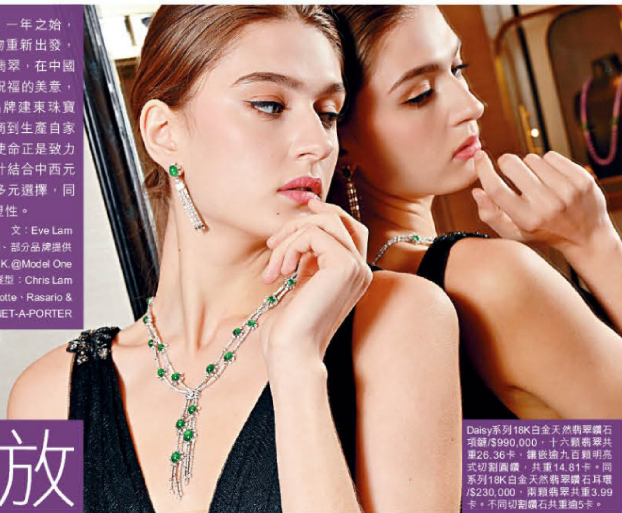
Daisy系列18K白金天然翡翠鑲鑽項鍊/$990,000，十六顆翡翠共重26.36卡，鑲嵌逾九百顆明亮式切割圓鑽，共重14.81卡。同系列18K白金天然翡翠鑲鑽石耳環/$230,000，兩顆翡翠共重3.99卡。不同切割鑽石共重逾5卡。

服裝提供：Marchesa Notte、Rasario & Maticevski @NET-A-PORTER