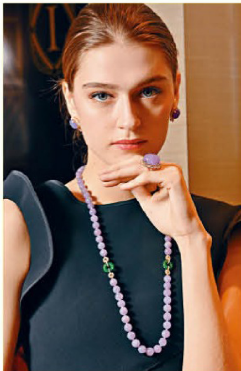
18K玫瑰金紫羅蘭天然翡翠珠項鍊/$650,000，配鑽石珠扣及扭紋圈綠色翡翠珠扣一對。六十三顆紫羅蘭翡翠珠共重661.64卡，兩件綠翡翠珠扣共重21.28卡。18K玫瑰金天然紫羅蘭翡翠蛋面鑲鑽指環/$1,700,000，翡翠重59.63卡，並鑲嵌六十六顆共重4.36卡的明亮式切割圓鑽。18K玫瑰金天然紫羅蘭翡翠蛋面鑲鑽耳環/$490,000，翡翠共重25.58卡，圓鑽共重3.58卡。

帝王綠是市場上最受追捧的珠寶級翡翠顏色，品牌其中一個著名系列Fireworks，就是以玲瓏剔透的緬甸天然翡翠為主石，配以閃爍的紅寶石和白鑽，運用三種不同材質，效果令人驚艷。系列的外形設計取材自煙花璀璨盛放的美態，滿載對生命的寄語。項目包羅耳環、指環、手鐲及胸針等，選用18K黃金或玫瑰金配圓形明亮切割的白鑽和紅寶石，增添奢華光澤。